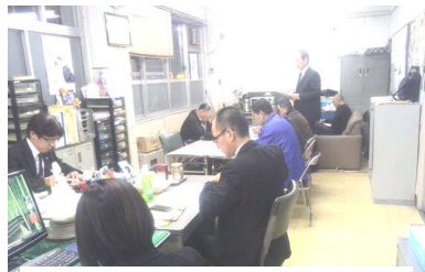
宮崎 出向者との交換会

「出向者との意見交換会」を11月13日宮崎、25日鹿児島、「ライフプランセミナー」（高年齢者、退前休者）を12月4日宮崎、5日・6日鹿児島において中央本部を講師に招き開催しました。中央本部からは、年末手当交渉