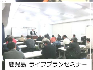
鹿児島 ライフプランセミナー

「出向者との意見交換会」を11月13日宮崎、25日鹿児島、「ライフプランセミナー」（高年齢者、退前休者）を12月4日宮崎、5日・6日鹿児島において中央本部を講師に招き開催しました。中央本部からは、年末手当交渉