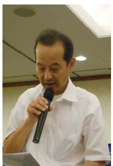
熊本総合車両所分会 桃北 代議員