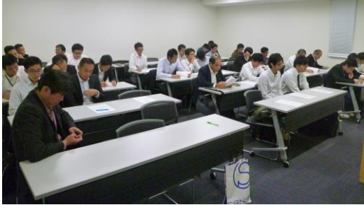
ホルトホール会場にて