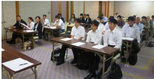
ラガール大分会場にて