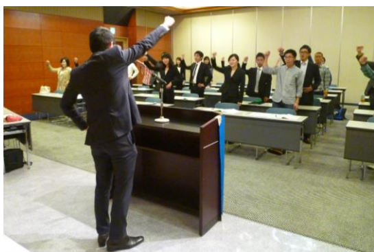
片上新委員長の 団結ガンパロー