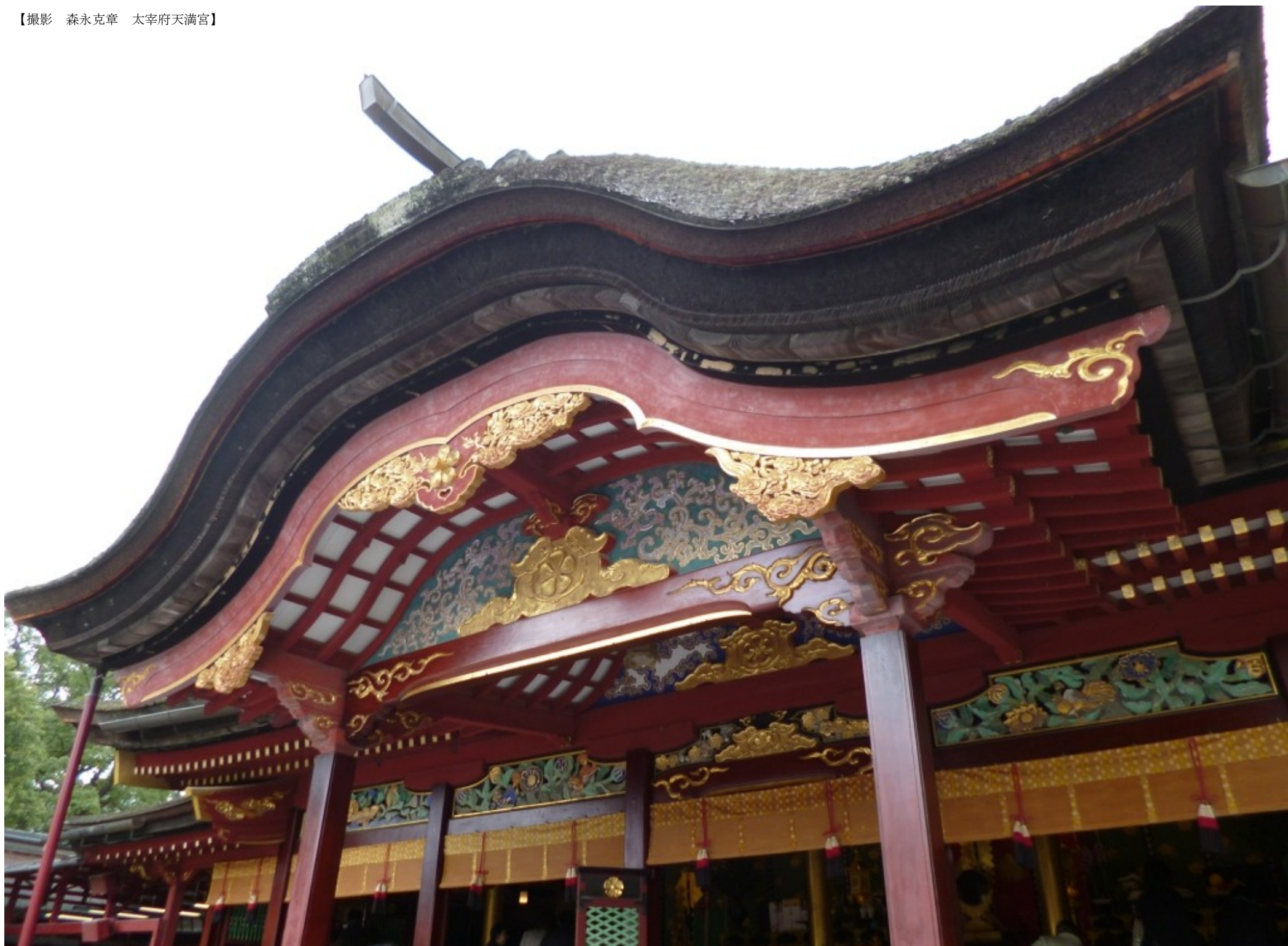
【太宰府天満宮】

役職員一同、組合員の皆様のお役にたてるよう 一生懸命頑張りますのでよろしくお願い致します。 本年もよろしくお願い申し上げます。